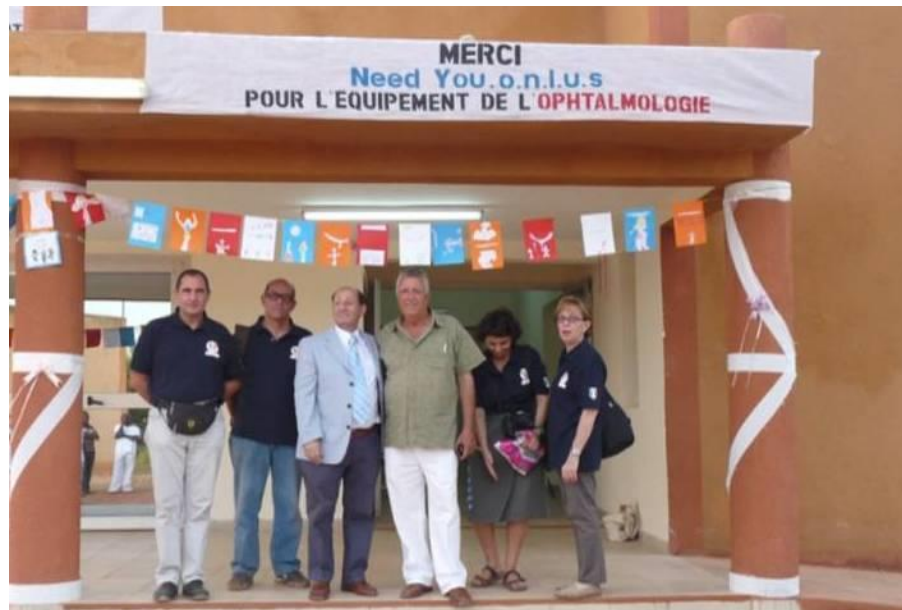
Le nuove apparecchiature

Abbiamo inviato al centro materiale umanitario e medico per un valore complessivo di 80.000 €.