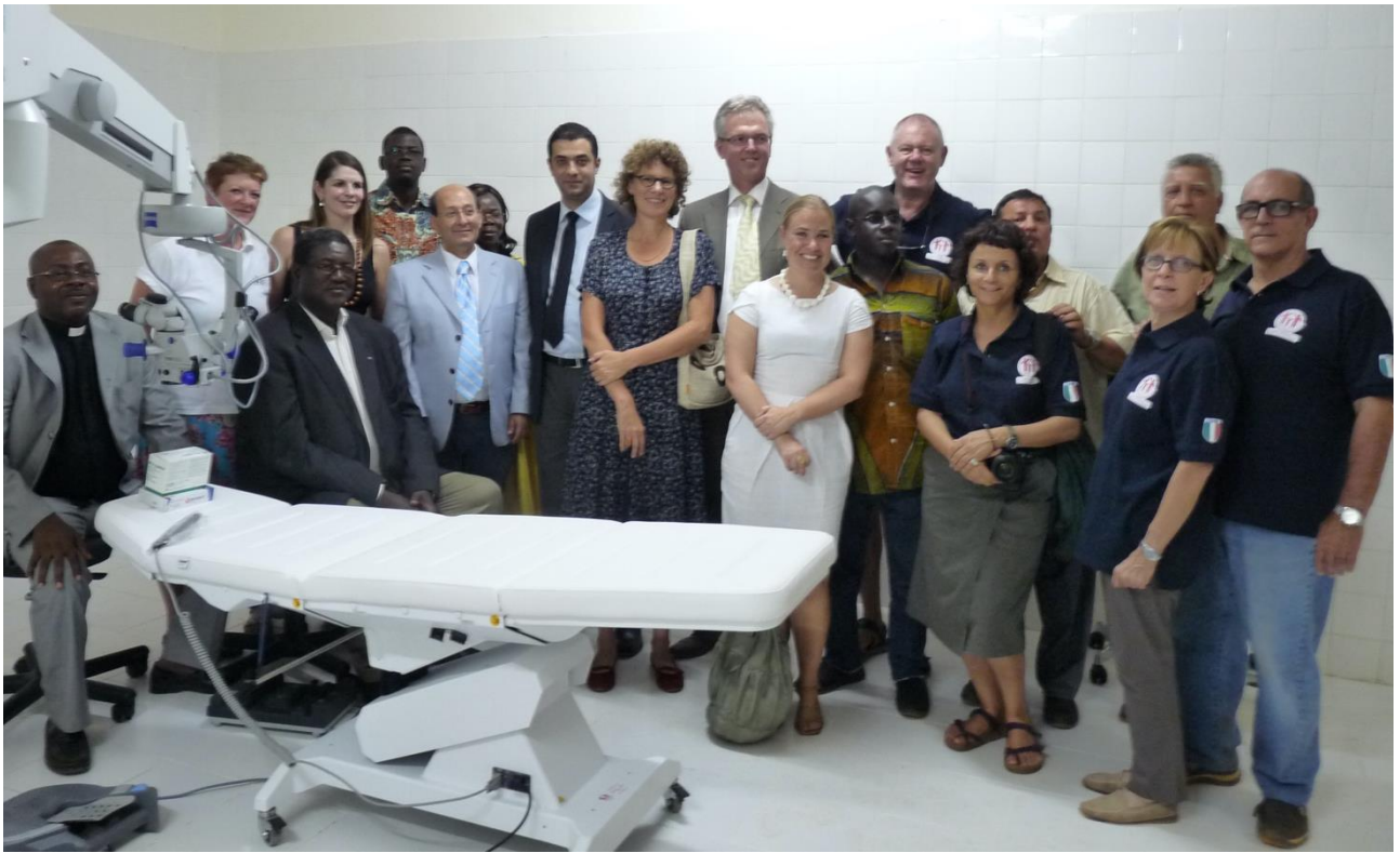
L'equipe medica ed i volontari Need You Onlus all'inaugurazione della nuova attrezzatura