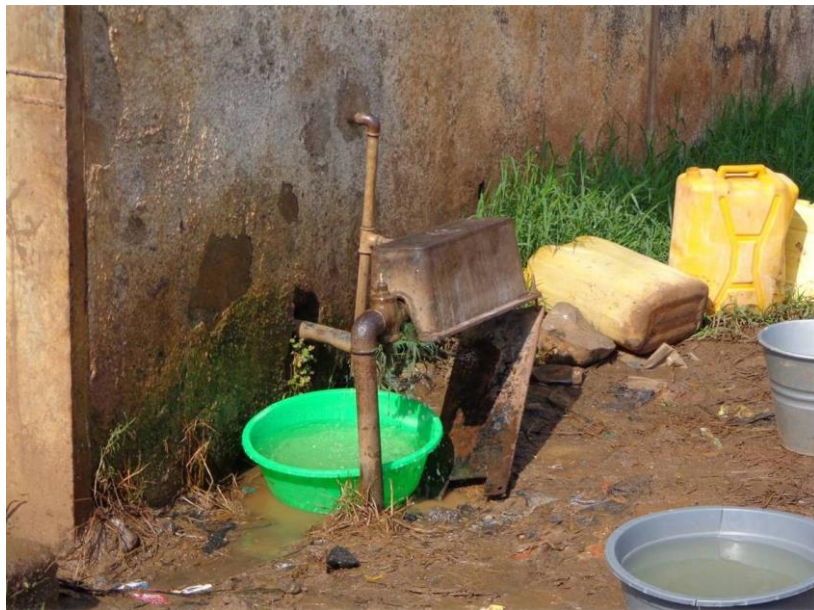
L'unico punto di approvvigionamento idrico per le 1.000 persone del villaggio prima dell'intervento Need You Onlus