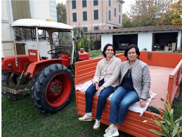
Le nostre benefattrici posano davanti al trattore