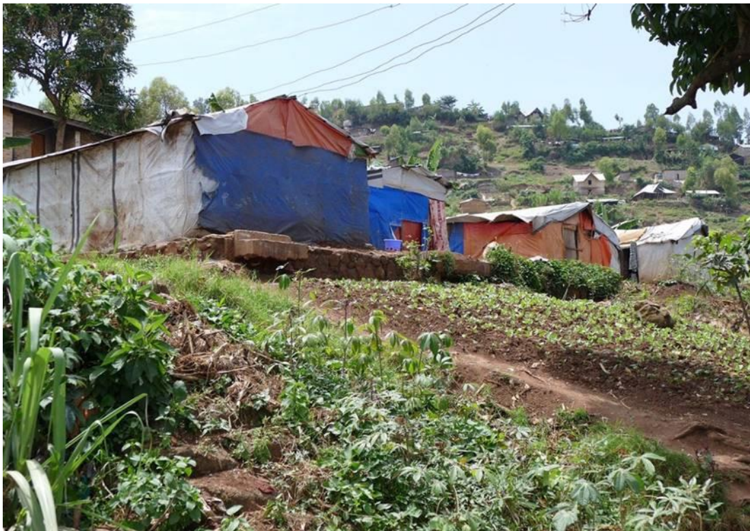
L'accampamento provvisorio spostato sulla collina

Il primo passo è stato quello di spostare l'accampamento sulla collina. Le piogge sono molto forti, non esistono strade vere e proprie nel villaggio, e le persone così affondano nel fango e vivono nella sporcizia. Spostare l'accampamento sulla collina e fornire agli abitanti delle tende che fossero più resistenti e potessero ripararli in modo migliore dalle piogge è stato essenziale.