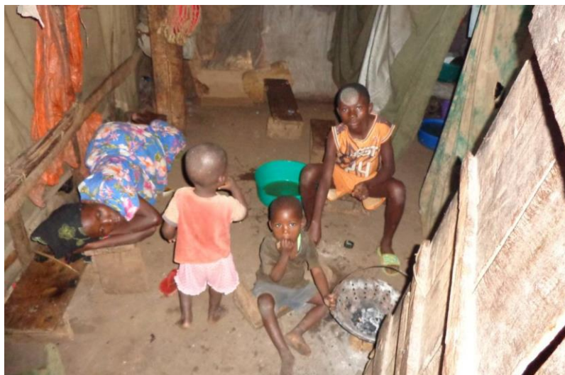
Una madre con i figli si riposa in una delle vecchie tende dell'accampamento.

Le Suore Francescane del Monte hanno sempre lavorato instancabilmente per poter aiutare la comunità e continuano tuttora ad essere un punto di riferimento essenziale per i bambini e le famiglie.