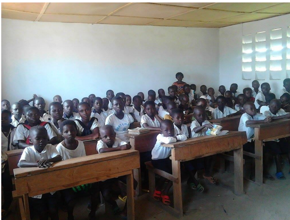
Una delle nuove classi