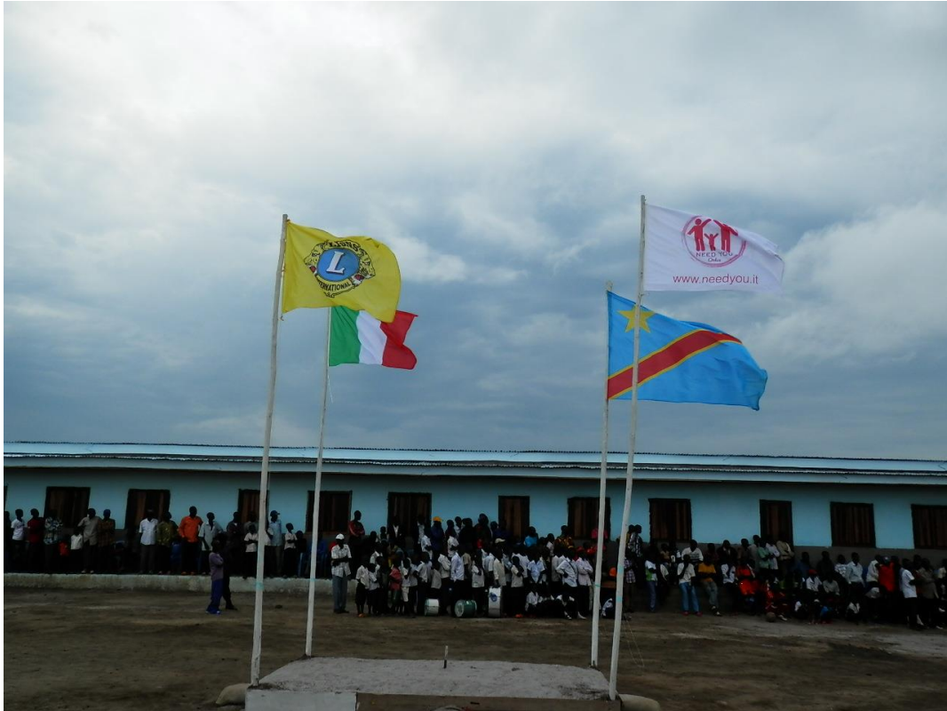
L'inaugurazione della scuola