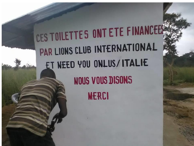
I nuovi servizi igienici della scuola