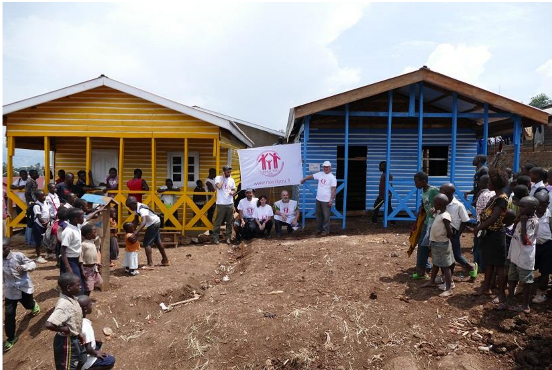
I nostri volontari posano davanti alle casette durante la missione del 2017